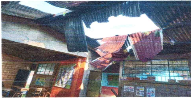
Foto 1: Se observa el colapso del techo por la caída de los árboles