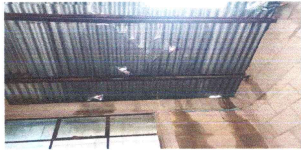
Foto 4: Se observa el mal estado en que se encuentran las láminas